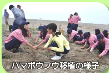
ハマボウフウ移植の様子

NPO 法人名取ハマボウフウの会では、協働事業として、名取の海岸再生を目指す「海岸のお花畑づくり」をさらに加速するため、全壊した保護区の再築と、移植会・ふるさと海辺フォーラムを開催し環境保全の啓蒙活動を推進しました。