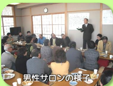
男性サロンの様子

NPO 法人仙台傾聴の会では、事業として「傾聴ボランティア養成講座」「男性サロン」を開催しました。心の支援の担い手を養成し、個人宅訪問実施と、男性サロンの開設により男性孤立問題対策として男性が気兼ねなく参加できる居場所づくりを行いました。