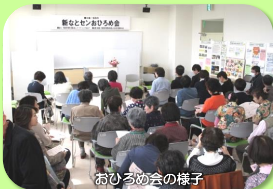
おひろめ会の様子

参加申込み30団体による活動紹介は、パネルに沿革や活動内容もわかりやすく解説されており、今後のイベント情報などもPRできるスタイルです。企画当初、展示団体募集で想定していた枠が短期間で一杯になる盛況ぶりで、関心の高さは今後の市民活動がさらなる発展をみせるのではないかと期待も膨らみます。