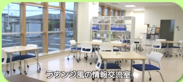
ラウンジ風の情報交流室

建物もスタッフも新米で、しばらくはご不便をおかけ致しますが、どうぞ温かく見守ってください。「なとセン」の願いは、名取市が元気なまち・笑顔いっぱいのまちになることです。NPO や市民活動をされている皆さんの夢や思いを応援します！！