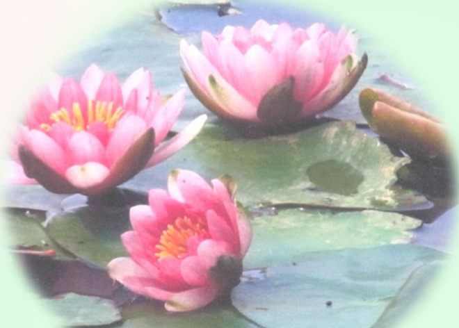
公園の池に咲く、美しいスイレンの花

十三塚みどりの会では「散策の時は植物をいたわる気持ちを持って、決められた遊歩道上を歩く、木の芽や幼木などを踏んだり、持ち帰らない」といった市民一人一人の協力を求めています。また、このかけがえのない緑と一緒に守ってくれる仲間を募集しています。