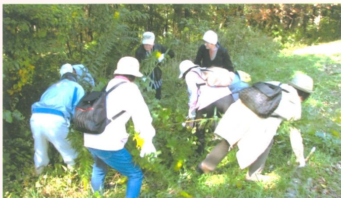
公園林内の下刈作業

十三塚公園は、名取市中央の手倉田丘陵に位置する史跡十三塚にあり、“スポーツ公園”・“歴史公園”・“自然公園”と3つの顔をもつ総合公園です。