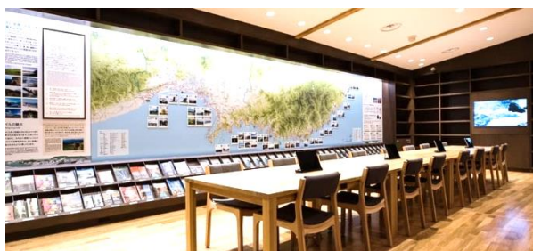
みちのく潮風トレイル名取トレイルセンター

最低限必要な装備をバックパックに詰めて、テント泊をし、街で必要なモノを調達しながら歩くハイカー(歩く人)もいますが、宿に泊まりながら週末2泊3日、日帰りなど、手軽に始められるところも魅力的です。