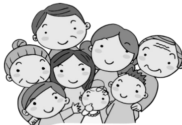
市民活動団体 町内会・自治会