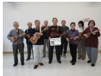
増田公民館で活動する皆さん

増田公民館・閑上 公民館・太白区 西多賀市民センター・宮城野区 高砂市民センター・ 増田公民館で活動する皆さん 泉区中央市民センター・PCC教会・BRANCH 仙台（長命ヶ丘）