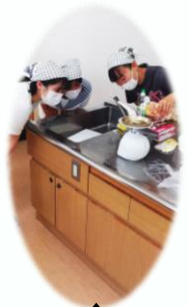
◀ 子ども食堂の様子